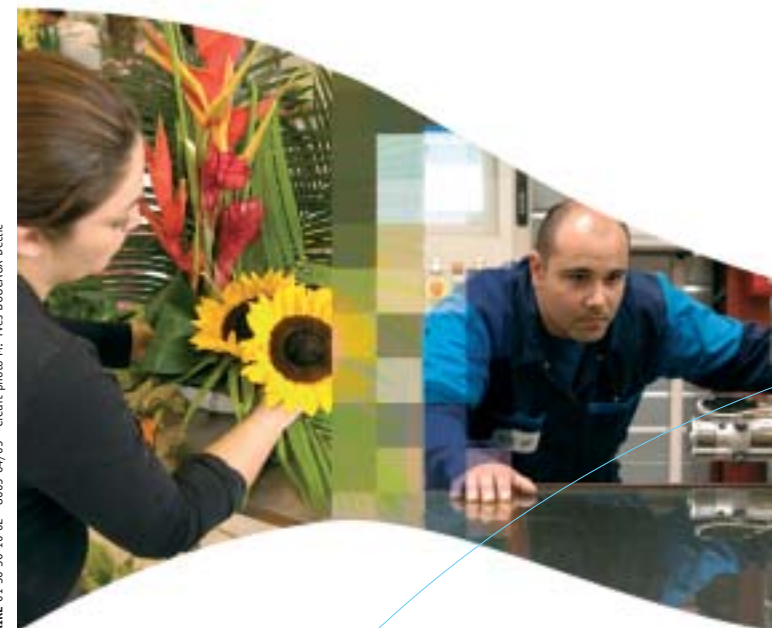
ATRE 01 30 30 16 02 - 8665-04/05

Des espaces emploi pour faciliter vos démarches